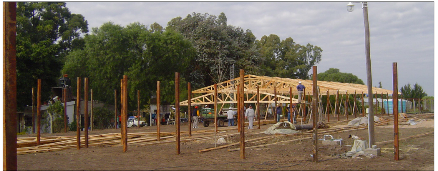
Sucursal de calle Almirante Brown en sus comienzos, allá por el año 2004.

Comenzado el año 2004, Gustavo Barbera da un paso más, guiado por su gran capacidad de visualizar los potenciales de la región en su rubro y decide arrendar unos terrenos de monte en las inmediaciones de la circunvalación, más precisamente en calle Almirante Brown casi al final, un barrio que ya no será el mismo. Allí se instala con el firme propósito de establecer su próximo emprendimiento, la producción propia de plantas.