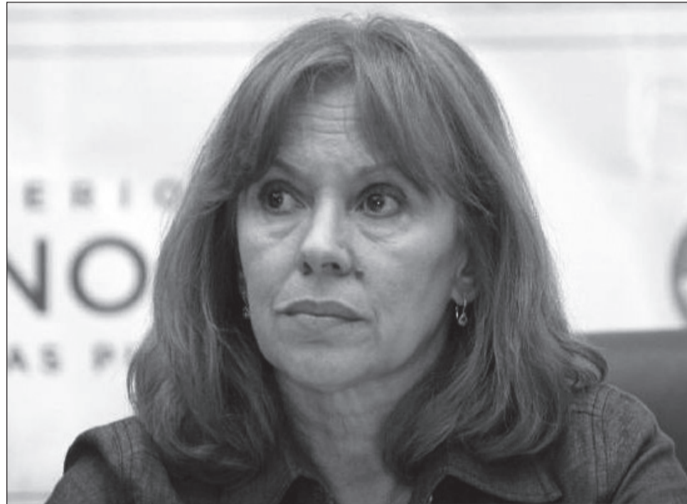
Con Kirchner se articularon “todas las políticas necesarias, indispensables para recuperar los derechos para todos”.

La jefa comunal dijo que durante la gestión de Kirchner se articularon “todas las políticas necesarias, indispensables para recuperar los derechos para todos”. Al respecto, mencionó la creación de puestos de trabajo, el desendeu-